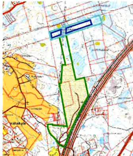
Kuva 1. Nykyinen toiminta-alue (vihreä) ja suunnittelualue (turkoosi+sininen).

NCC Industry Oy on toimittanut 23.3.2023 Uudenmaan elinkeino-, liikenne- ja ympäristökeskukselle (ELY-keskukselle) lausuntopyynnön YVA-menettelyn soveltamistarpeesta yksittäistapauksessa. Toiminnanharjoittaja lähetti lisätietoja asian käsittelyä varten 24.4.2023 ja 9.5.2023. Asia koskee kiinteistöä Metsälä 505-409-5-1650, Ohkolan louhosalueella Mäntsälässä (kuva 1.). Suunnitteilla on 14,78 ha kokoinen louhinta-alueen laajennus sekä ylijäämämaiden vastaanotto louhoksen maisemointitarpeisiin ja mahdollisesti eteenpäin myytäväksi. Vuotuinen louhintamäärä olisi keskimäärin 87 500 m 3 ja maksimissaan 190 000 m 3 /v. Suunniteltu louhintataso on + 73 m. Ylijäämämaita on tarkoitus ottaa vastaan vuosittain maksimissaan 49 500 t. Tarkempia tietoja toiminnasta on taulukossa 1.